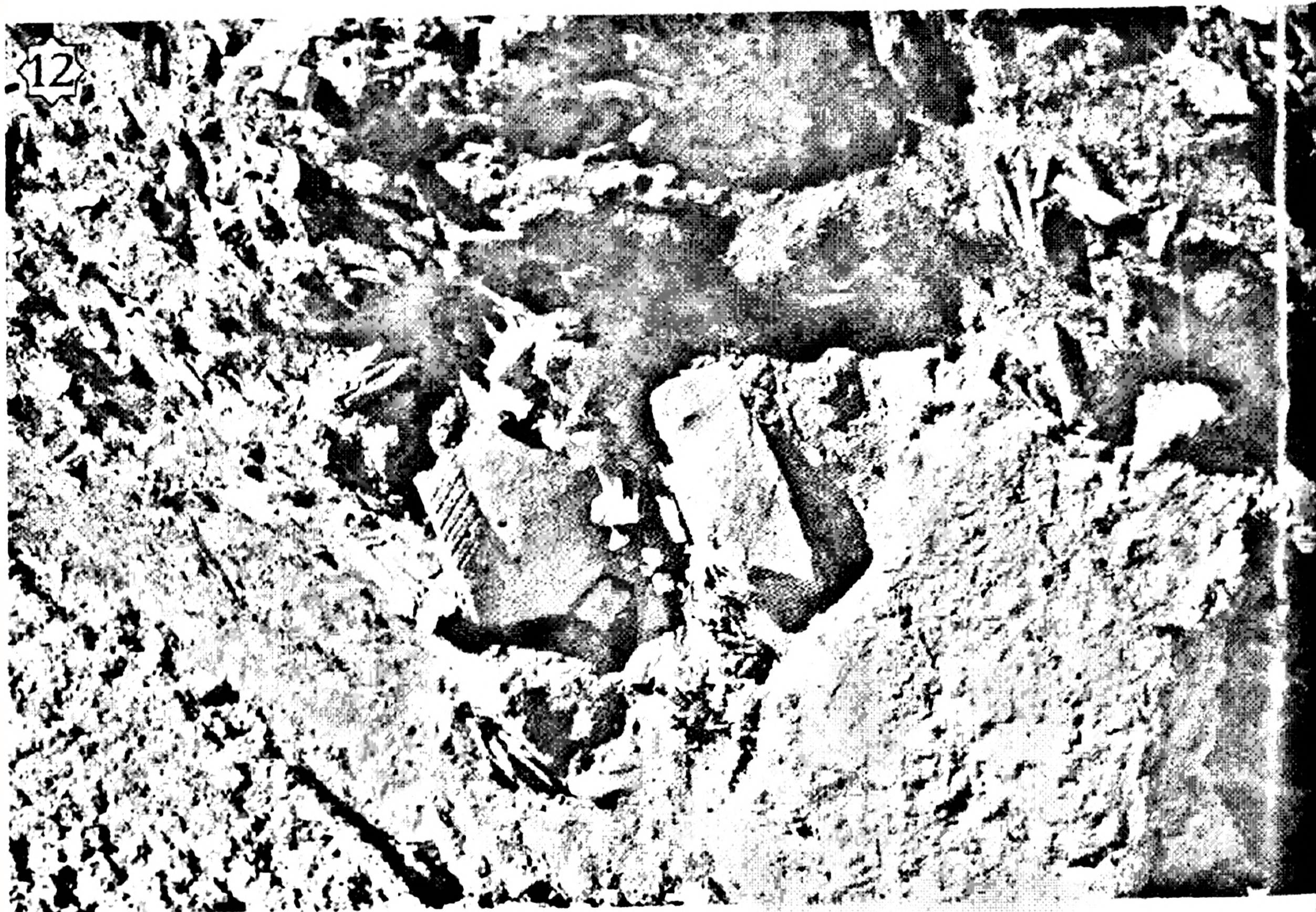
11. Нидерланды корольдігінің елшісі зайыбымен. 12. Қазба жұмыстары. Болме.