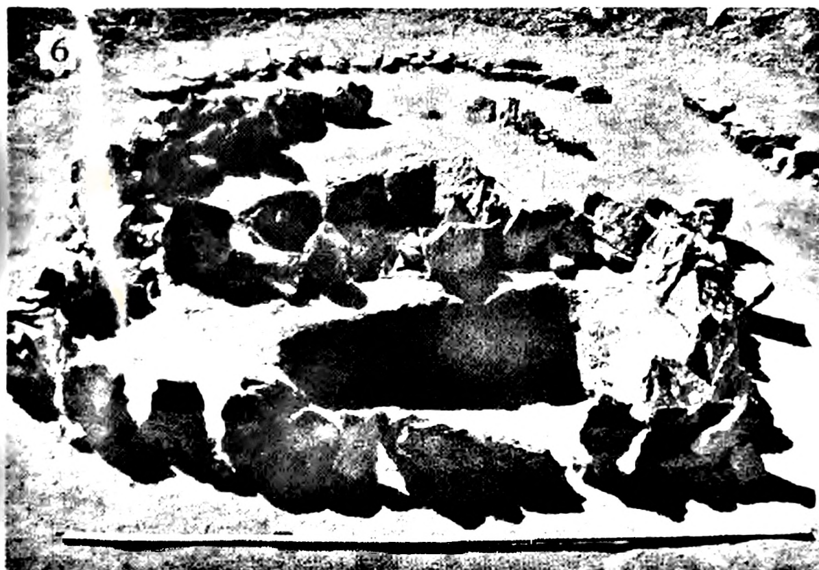
5. Археолог З.Самашев пен журналист Ө.Әлімгереев. 6. Иманқара қорымы.